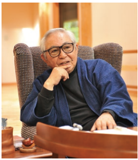
倉本 聡 くらもと・そう 脚本家・劇作家・演出家

1935年東京都出身。東京大学文学部美学科卒業。1963年、脚本家として独立。1977年、富良野に移住。1984年、役者と脚本家を養成する私塾・富良野塾を設立。2010年閉塾後は、卒業生を中心に創作集団・富良野GROUPを立ち上げ、舞台公演を中心に活動する。代表作は『北の国から』『前略おふくろ様』『うちのホンカン』(以上TVドラマ)、『悲別』シリーズ、『ニングル』(以上舞台)、『駅STATION』『冬の華』(以上劇映画)など。2017年に連続TVドラマ『やすらぎの郷』、2019年には新シリーズ『やすらぎの刻〜道』が放送された。2006年よりNPO法人富良野自然塾を主宰し、環境保全にも力を注いでいる。ライフワークとして、森の様相を描く点描画と添え書きに取り組み、2017年より全国14ヶ所で「点描画展」が開催されている。